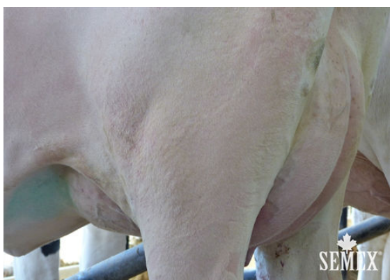
DESLACS INTEGRAL ANARICK